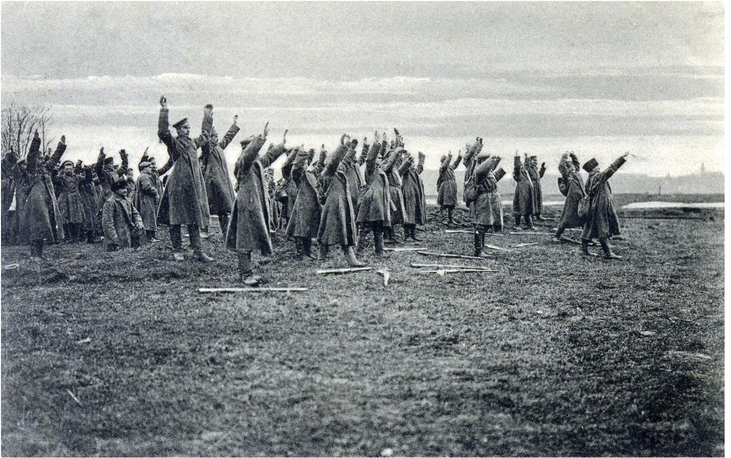
Żołnierze rosyjscy poddają się w Sękowej